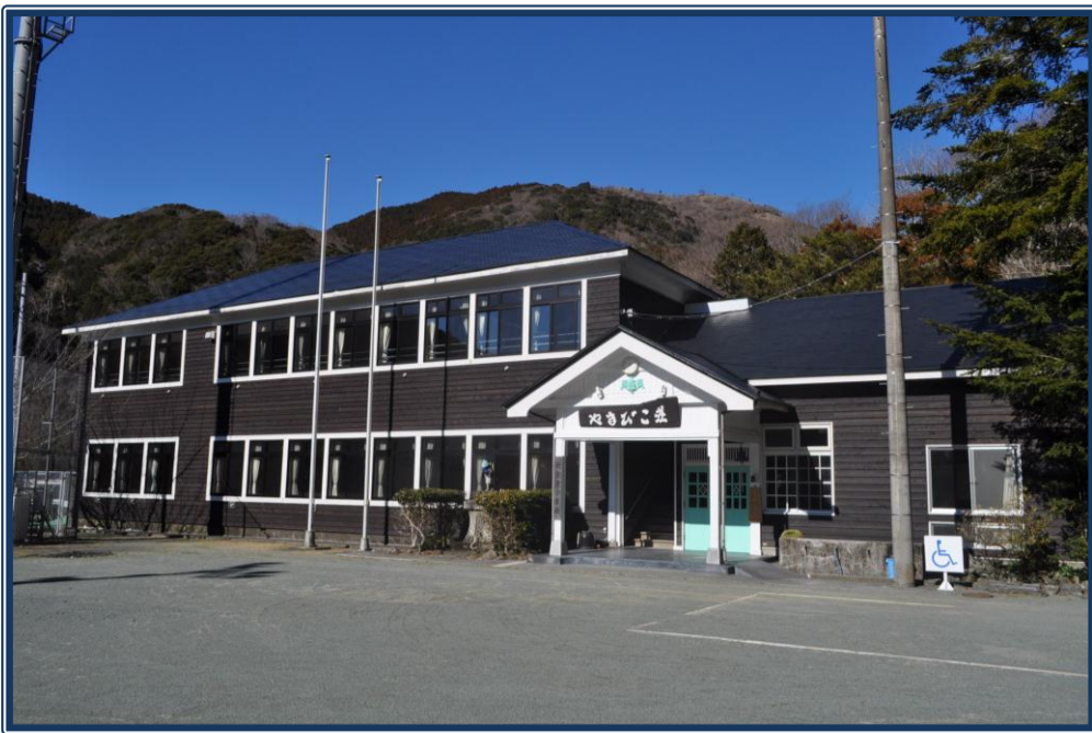
西伊豆町営やまびこ荘

山間の集落の中に建つ小さな木造校舎。長い間、多くの子供たちが元気に学んでいた。昭和48年、児童減少のため廃校となった。しかし、廃校後の校舎を、さし、建て直して、町営の宿泊施設として活用している。自然温泉を引込み、浴室は2年耐震補強工事を行った。また、改修工事の際、古い木造校舎の基礎を補強し、筋力強化を図った。また、耐震壁を新築した。