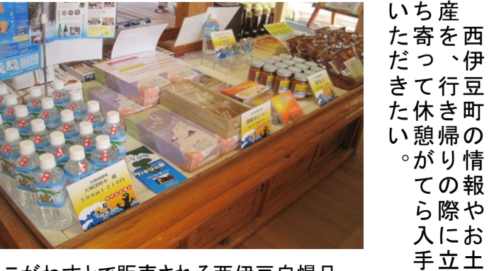
こがねすとで販売される西伊豆自慢品

西伊豆町の情報を入手したい。産物や、お土産、お風呂の予約など、様々な情報が、こがねすとで提供されています。ぜひ、こがねすとを訪れて、西伊豆の魅力を堪能してください。