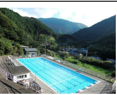
春もあったか、やまびこ温泉プール

い非 せ時広に木道 と力歩らくい 歩のこ伊 場と桜て期大あがは松良にレ、、と海道距莊豆西 所のものいになる続、崎いあべ平軽バ浴が離か市伊 だ訪咲る合花休い6、。つる坦いりい点にら土豆 。れく。わ畑耕てキ那 たまな山エ、在は車肥町や て時 せが田い口賀 コで道登|川し、でなや い期 て、をてに川 |、をりシ浴て数3ど、松 たには 花桜利、渡堤 ス自行クヨい多0、松 き、 咲咲し沿桜遊 を分くラン、るく分や崎 た是 かくたい並歩 す体散か多浴 遊どび、